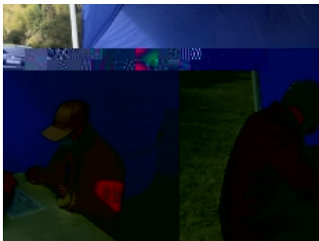
坚决守护家乡的“1”确诊

2016级网络 " Q 备 \SQ aZb 安^ \ Q >处: 务^ 外 > n O~ BQ =>QA eM7QAF>G外= \ Q! 遛 QA 知oB M7 导QA-p 行 9 8 c b前 \ VP 安^ 确_ \ : [0] {b前 安 确_ HO : 24! 4 守BN 449有犹豫 怨 \ $ {Q4# a l# _ 守 堡垒 VP A 安 外 5 有 S FJQ F; SQa当 9 / - * ) BV W 行U { 责任 担当 / - 能 战t 有W战9 . 战 - e