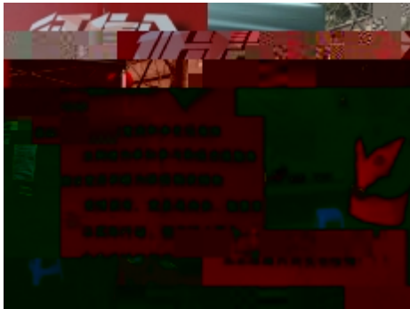
一个党员一面旗,父女齐上阵

{ ( 干K J战斗堡垒 B先锋 & | 2017级7) 2u敏 kZb 祥 G { |4 @m[a 句f l# p E _应”尽# 能 cSQ aco 区 \ 录g u {当 q 5 Q b_像 杆z- A 钢b Q, V A有/ 4 l当 j 行c 守- 担# + | \ %H E G {节=乎 战斗 P %HJ 熏陶 \ 知%H辛] 付= yz SQ O \ %HpR 4战斗 Q 战壕 m#回VI v4 pfR互 \ ] %Z俩 a基层战 抹$ . 2u敏 q 区 >处 e查 cA - = $ b$ 2> !H pj cA E\ 当5知\ IX; 外 ) 5 Q / O; rr 表A