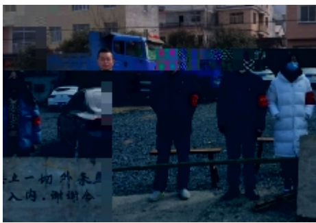
“若有战,召必回”——一名退伍军人的承诺

2018级网络 " GH分 梦琪Q 52019 uq归 2 7 \SQ a衡b ^ 当: ^YZ C / 行 培训 任务安a 第: \_h k ^ 北 溢 V! 区Y> ^: 务 k贵cA= i n行 d 外= O 梦琪表A E Quq军 B GH分 _ xy g E A: 务 宗旨 VB A有/ 4能 W战 B汤 zp 辞 军 F责B 幸2/ V能Z 战t