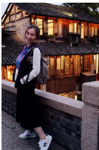
YZ[ " 9) * \