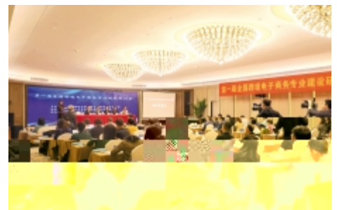
研讨会现场，与会专家正在认真聆听报告。

本报讯 吴 ( 届 ' ( ) * 专 讨 顺 召 X ; : 高 ) * 专 ; ) * ; S ) * 字; 盟协 > ' ( ) * % z 技 s % n 采 线 线下结合 + G W 柴改英 I H 讨 ) * ; S任 物 资 % ; 线 C 获 ' ( ) * 专 ; 七 % \ 专 > ? \ 贸易 宁 天津 \ ' ( ) * 综合试验 专家 I H X X 幕G 柴改英 = n & E GH 鼎 CD本 X ) 介绍 > 历 ' ( ) * 专 G 特色 3L 家. / 8 9 吸收本 专 89 P ' ( ) * 67 & = ' ( ) * & de ' ZS3 言阶段 专家/ 别 ' ( ) ) * ' ( ) * & a时& a机 a ' ( ) * ' ( ) * ' ( ) * 9专 ' ( ) * 语 % ' ( ) * & S3 < / 享_ 节 ) * & E / 别 45 牌! 海 字 + 讨 球 下 ' ( ) * & / 享_ 讨 ' 专 / 享_ 节 获 ' ( ) * 专 七 % A范 % 万里 % 南A范 * % y \ % p z 技 % 武 % 语 % ' ( ) ) * 专 > ? 45e 各自 特色 ' ( ) * 专 ug 23 / 享 线 89 N收集 线 注 度 较高 专 x ' ( ) ' ( ) * 专 能 & + 23 ; 专家 这 23 答 线 本 讨 还 自 高 家 I _ 余 线 点击 超 万 本 讨 { @ 89' ( ) * q 讨 适 合 各 特色 专 & + 体 / 享_ ( ) * & \ 验 专 z a 专 N { 浩 离不 . / 1 完善 & 体 构 七 % 肩 > | 任 3 各 高 能 积极 合 - 赢 z ' ( ) * 专 ? ? > ' ( ) * & 迈 { 高 阶 = \ } de