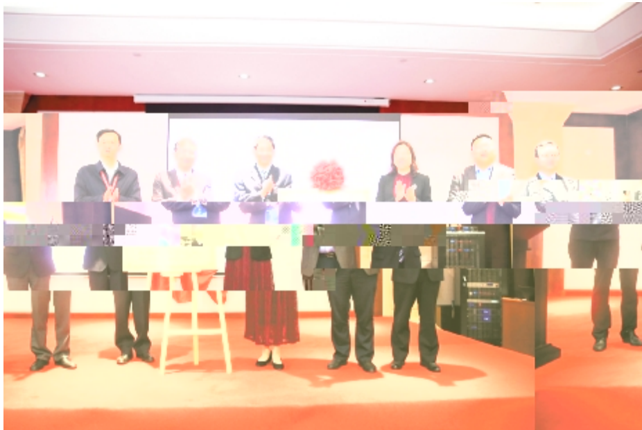
揭牌仪式现场，多位领导和嘉宾出席并剪彩。

本报讯 袁林锋 记者 薛海 升 乾坤万里蔚 天 金秋紫气翻 语; < i | G 语 % C 届 # $ 多语种 语; 高端R 坛 自 : = z % 能机构 专家 q t 下 ~ Wt i I H J _ SD 幕G 柴改英 SD闭幕G z N SH范钧; 海 语; I 兼总编 ; : 高 ; 英语; : S任 莲珍; 语 朝 : I H 海 语 R 海 语; I 语; < I 高; I 高 专家 q 高 士 士 < 应邀 幕G 各 E! 热 烈 % ) 介绍 基本 I 家 # $ 倡XW纵 7 施 放 i 语 略 | } 口 i 语 < N a 67 S | } 措 语; N 球 Q略 | } [ 6 a时& 改 a 于A高 语能 | > V 于快; & I m 构 运- 体 XN m 揭牌I G < 6 时VN 语; 语; A 1, 89机 OL 家 D续 ; 注 CD 语; < 语 7 ; 改 家Q略 + 7 改 放 A升 家