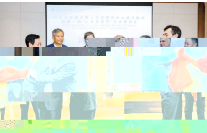
土耳其研究中心揭牌仪式，多位专家出席并发表演讲。

本报讯 衣勋轩 自 : = U 各 < 其 < ~ 专家 q t ~ Wt 语 % _ 海 < % 其 < 下 其 i I H J 届 其 < s 讨 其 海总 U < % % _ 海 < % 特 顾2 其 使 阳 z z << i I H I H J _ SD 其 使 < % % _ 海 < % 特 顾 2 % 8: 23 < % 特 顾2 _ 海 < < < z % S 西任 < % 海 < % 特 高 < y 超 语言 < 别 < % 其 < S任 < % % _ 海 < % 特 顾2 < % S任 _ 海 < % 特 高 < j 海 < % 语 ; _ 海 语言 < % 特 顾2 j 海 23 < % < L _ 球 y 总编 : S任高 M 海 z 技 X U ) 机 企 : : 集! 海 资专 / 语 信 西M : z 技 语 语 ( 语 q % % 机构 专家 应邀 别 < S ( 语 % • 烈 西 q I _ 海 < % % 马 其 < S任 y [ : = % 老A X