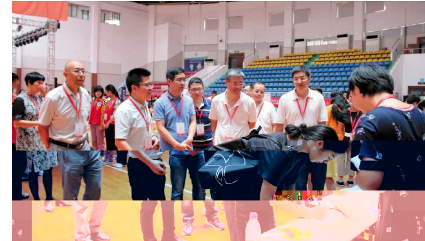
9月15日,我校2000余名2018级新生来校报到。校园里人山人海,带着笑容和期待,新生们背起行囊、暂别父母,迎接浙外新生活。 图为校领导现场了解新生报到情况。

活技能开始,做好 我- 理,培养严 的 精神,养成良好的行为习 / ;希望 你们 O 地、努力1 出,将所学1 2 " 7 父 母} 再脑 恭 恭 @ 7. 29 7 1 6 2 4 0 6 9 7 7 1 6 5 4 2 3 2 9 6 6 8 0 3 3 3 2 1 7 1 4 2 3 1 7 5 6 4 6 2 4 1 6 1 6 1 0 1 6 1 0 3 4 , 勇 5 地 创 新 创 业 、 6 7 a 3 6 T j / F 7 + 1 6 . 2 4 T f 6 O T D ( # ) T j / F 5 + 6 . 2 4 T f 2 . 8 8